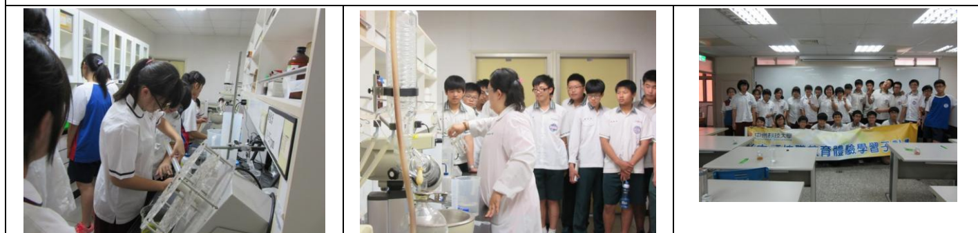
二年級職涯探索：中州科大技職教育體驗營（農業群+食品群+化工群）