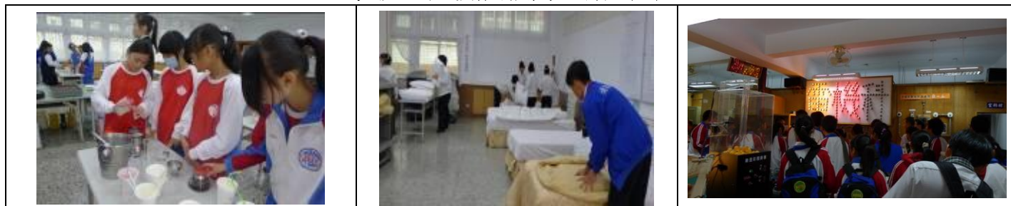
二年級職涯探索：達德商工（餐旅群、電機電子群）