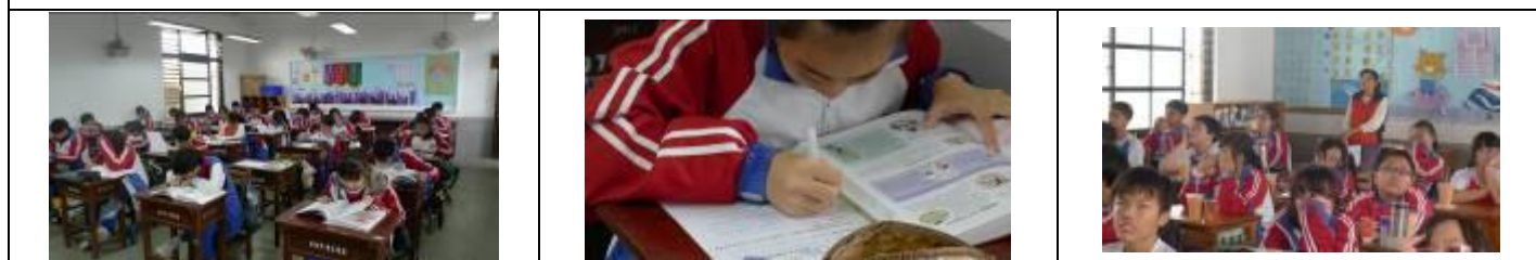
二年級職涯探索：班級共讀【世界職業圖畫百科】及學習單撰寫