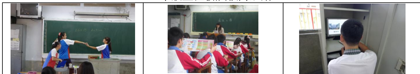
三年級輔導活動課：360 行 Action—認識各行各業、適性入學文宣導讀、高中職簡報