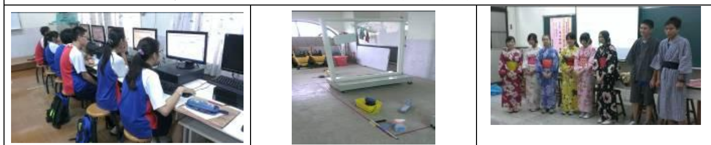
二年級職涯探索：文興高中 （多媒體製作學程－藝術創作、商業服務學程－一日店長、應用日文學程－日本文化）