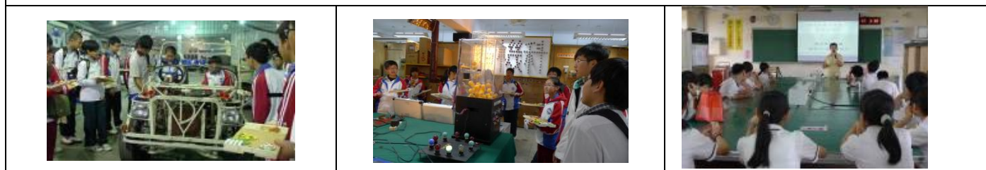
三年級高中職參訪：達德商工、崇實高工