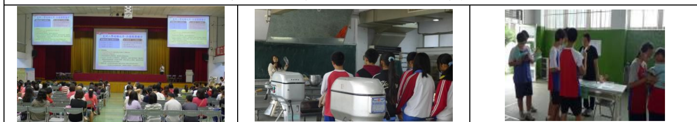
三年級升學博覽會：崇實高工、員林農工、本校