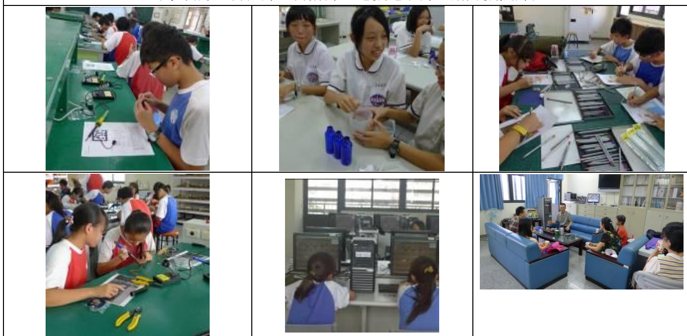
二年級職涯探索：崇實高工 (電機科、化工科、室內空間設計科、電機空調科、資訊科、綜合座談)