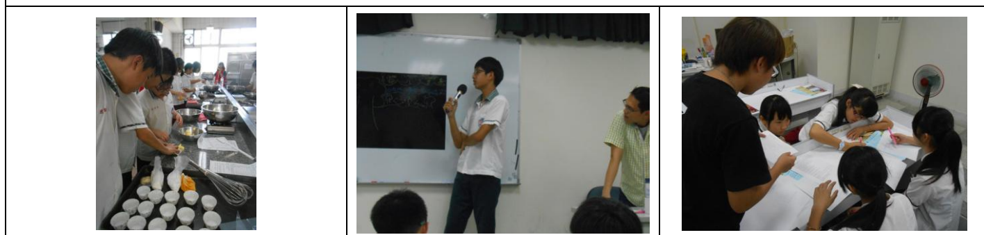
二年級職涯探索：溪湖高中（餐旅群、學術群－自然學程）