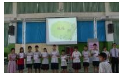
一年級得勝者教育課程，上學期：問題解決能力；下學期：情緒管理