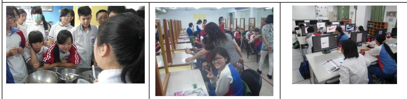
二年級職涯探索：同德家商 (餐旅群+食品群、家政群、藝術群)