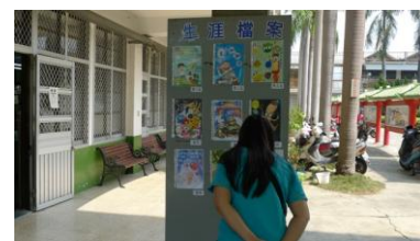
一年級生涯檔案封面設計比賽：評選、頒獎、運用親職教育日展示成果