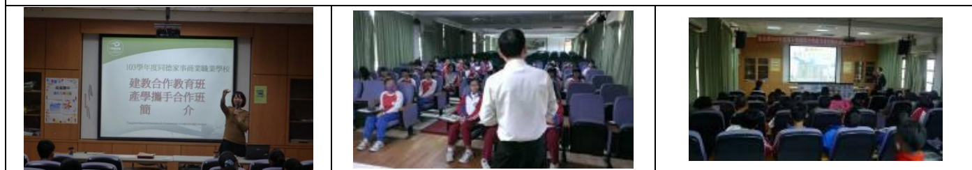
高中職集中式宣導：建教合作班、普通高中