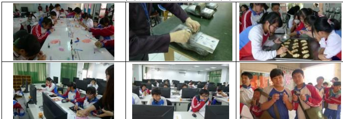
二年級職涯探索：大慶商工 (家政群、餐旅群、藝術群、電機電子群、動力機械群)