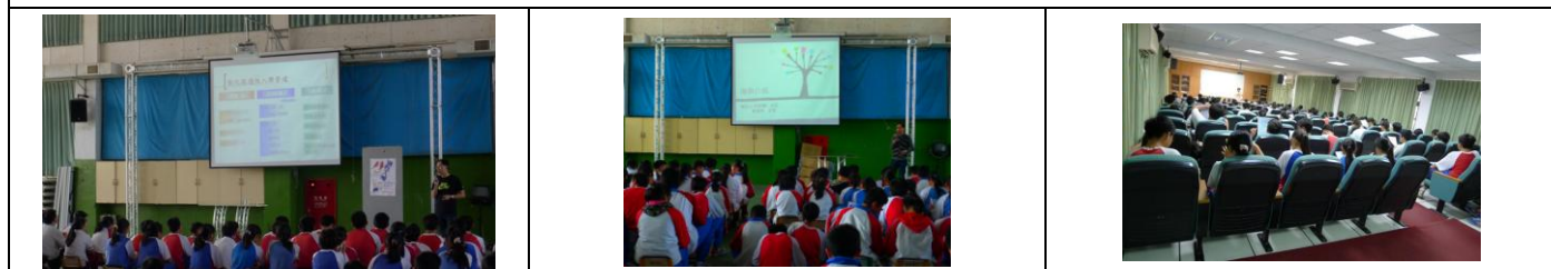
三年級適性入學宣導：對一般學生（各項積分、教育會考、職群介紹、志願選填策略）、對技藝班（技優甄審、實用技能學程）、對彰師附工特招學生（術科、備審資料準備、面試策略）