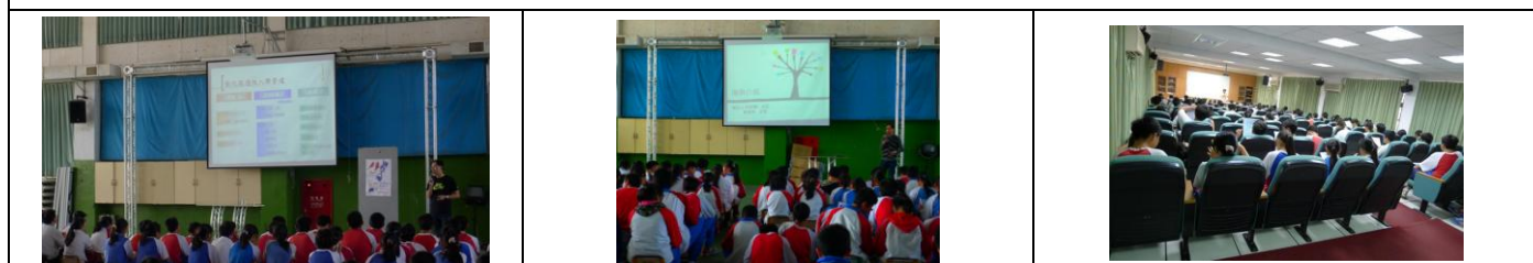
三年級適性入學宣導：對一般學生（各項積分、教育會考、職群介紹、志願選填策略）、對技藝班（技優甄審、實用技能學程）、對彰師附工特招學生（術科、備審資料準備、面試策略）