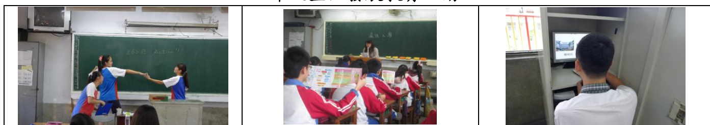
三年級輔導活動課：360 行 Action—認識各行各業、適性入學文宣導讀、高中職簡報