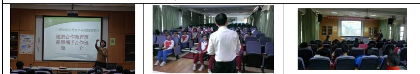
高中職集中式宣導：建教合作班、普通高中