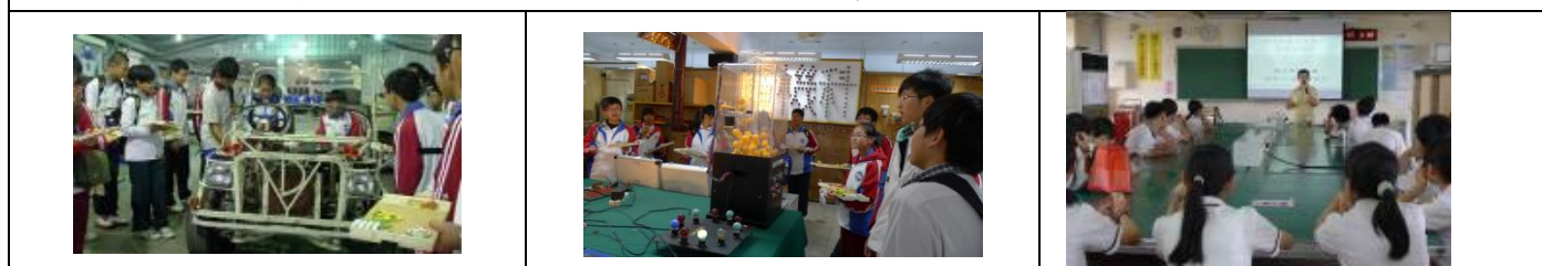
三年級高中職參訪：達德商工、崇實高工