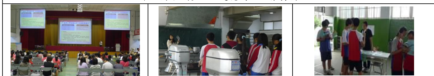
三年級升學博覽會：崇實高工、員林農工、本校