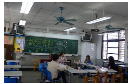
一二年級生涯發展教育宣導：導師場（生涯檔案與輔導紀錄手冊之建置與應用）、家長場（十二年 國教綜合宣導、親師會談）