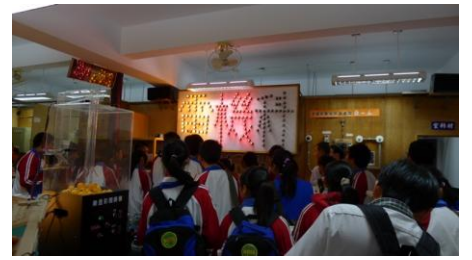
二年級職涯探索：達德商工（餐旅群、電機電子群）