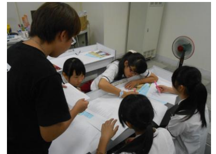
二年級職涯探索：溪湖高中（餐旅群、學術群—自然學程）