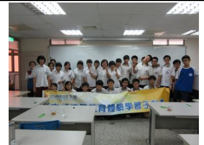
二年級職涯探索：中州科大技職教育體驗營（農業群+食品群+化工群）